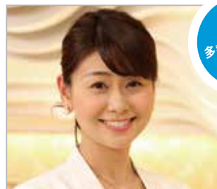
山中章子(フジテレビアナウンサー)