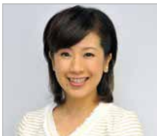
関純子(関西テレビアナウンサー)